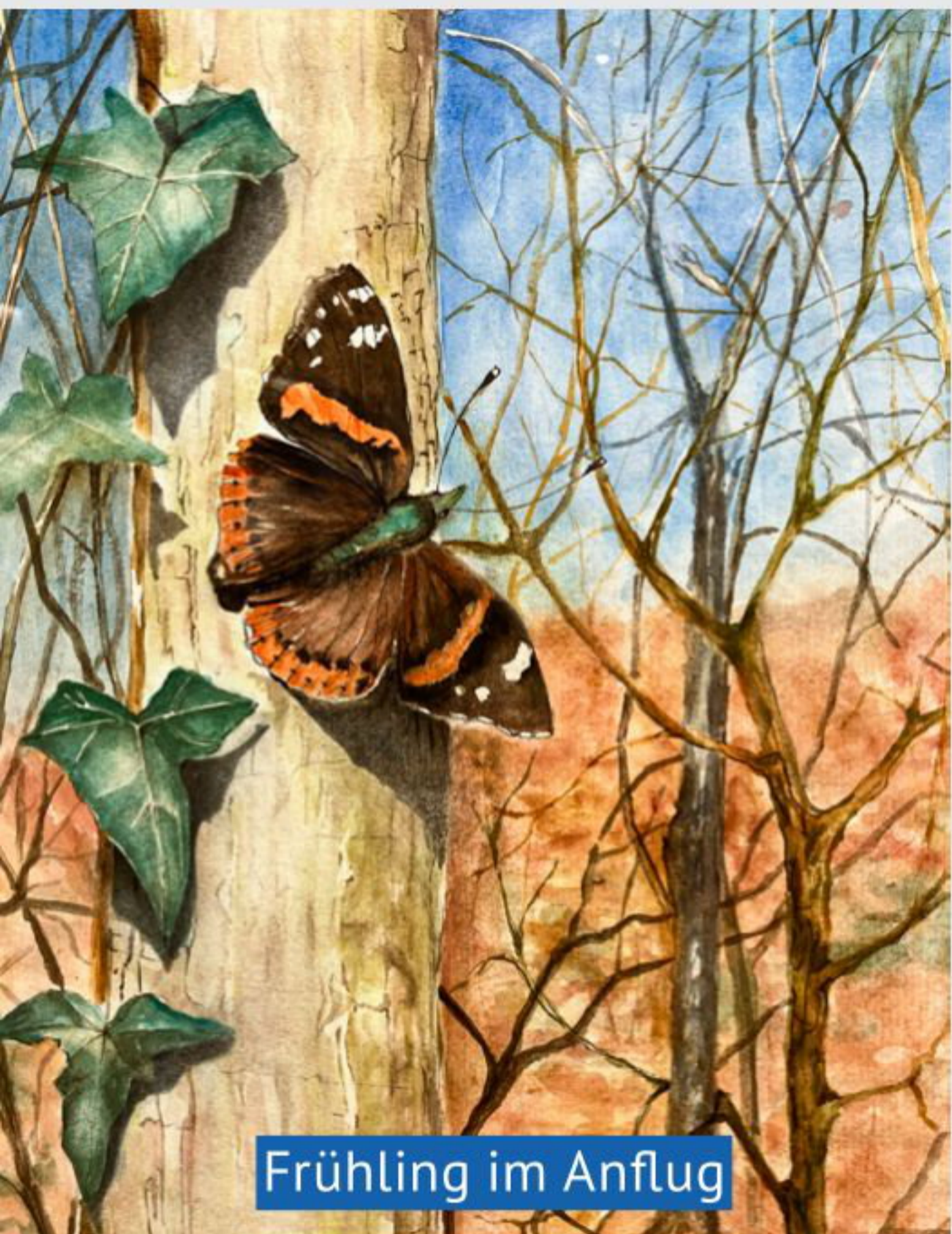
Frühling im Anflug