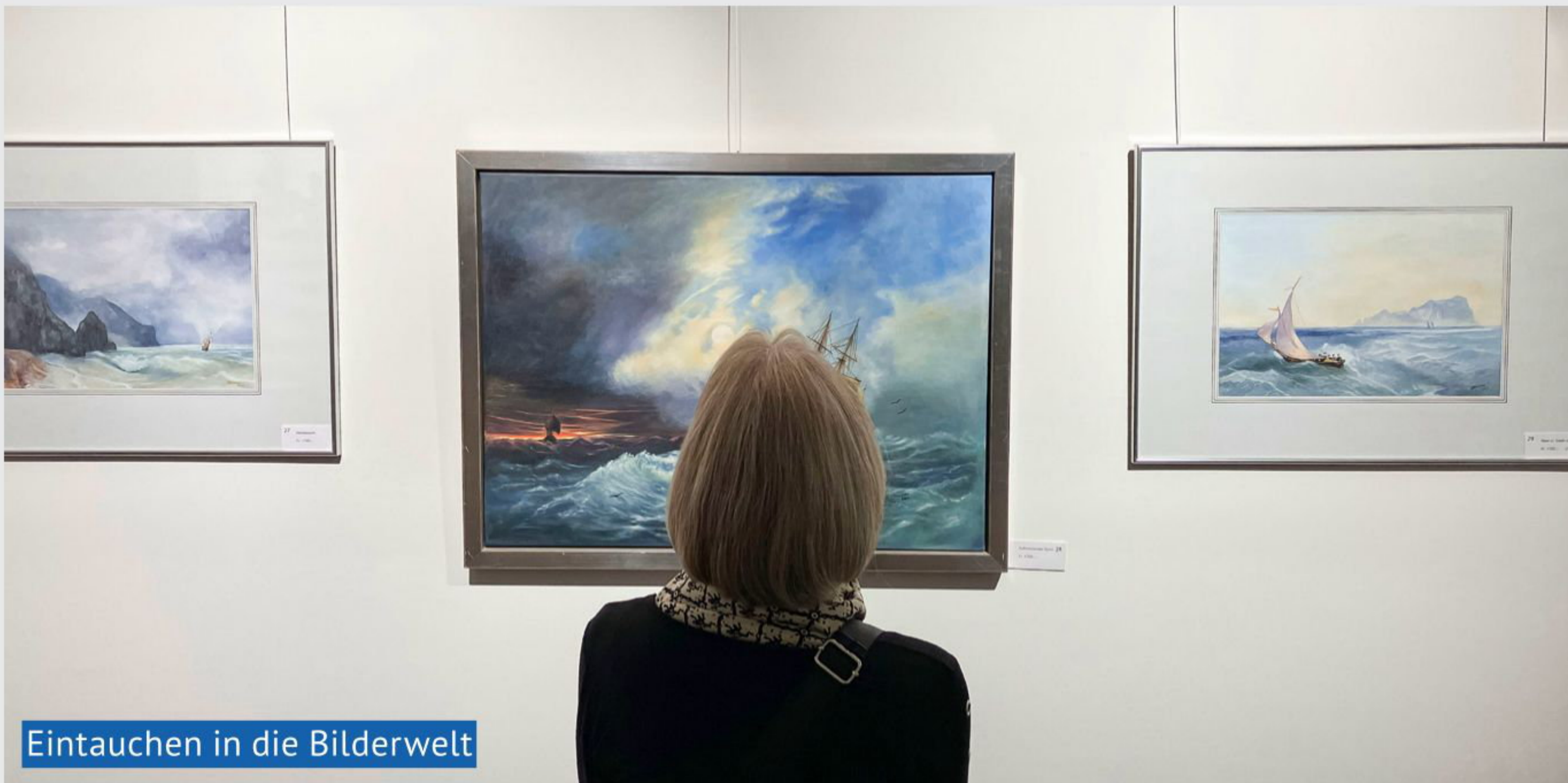
Eintauchen in die Bilderwelt